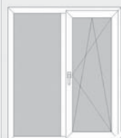
всего за 9 499 р. под ключ

реклама Тюли, портьеры, комплекты для кухни и гостиных. Ковры, паласы, дорожки. В ангаре за универмагом в с. Б. Нагаткино ОГРН306732504400010 от 13.02.2006г.