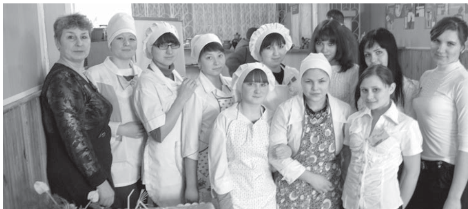
Профессия повара одна из главных в мире. В детском саду и в школе, на заводе и в поле, в поездах и в учреждениях общественного питания - всюду люди рады труду поваров. От того, как накормить человека, зависит его здоровье, настроение и производительность труда.