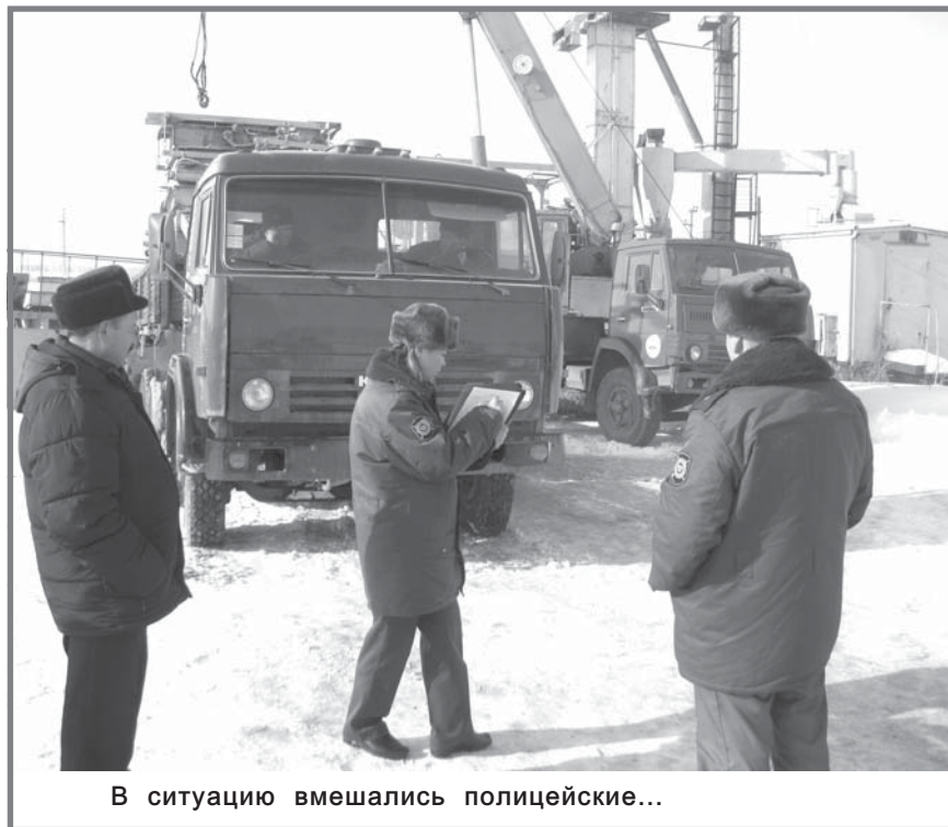
В ситуацию вмешались полицейские...

В выборные кампании депутатов Государственной Думы и Президента Российской Федерации самой главной проблемой на селе народ называл плохое, даже отвратительное состояние улиц, дорог. И уничтожение завода - яркий пример того, как власть откликается на нужды и чаяния населения. Народ не знает фамилии тех, кто дал приказ на разбор и вывоз завода, но обвиняет всех - начиная от Президента и Губернатора и заканчивая местной властью. Оценку таким действиям люди дают властным структурам своим голосом на выборах. Так чего же удивляться, когда тот или иной кандидат или партия показывают низкие рейтинги? Народ обмануть нельзя.