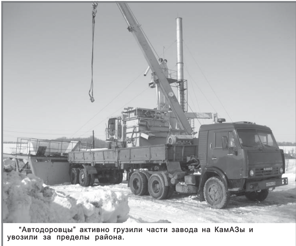
"Автодорожцы" активно грузили части завода на КамАЗы и возили за пределы района.