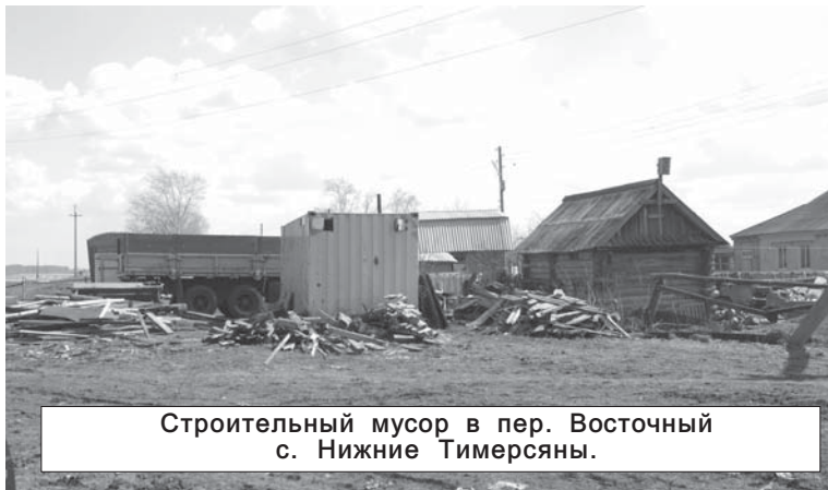
Строительный мусор в пер. Восточный с. Нижние Тимерсяны.

Несмотря на регулярные субботники, количество несанкционированных свалок в некоторых сёлах не уменьшается. И не только окраины, овраги и лесополосы утопают в мусоре. К примеру, в селе Новые Алгаши свалка "украшает" центральную улицу села. Пластиковые и стеклянные бутылки, полиэтиленовые пакеты и другой бытовой мусор, похуже, копился здесь несколько лет. Подобная картина и в другом конце