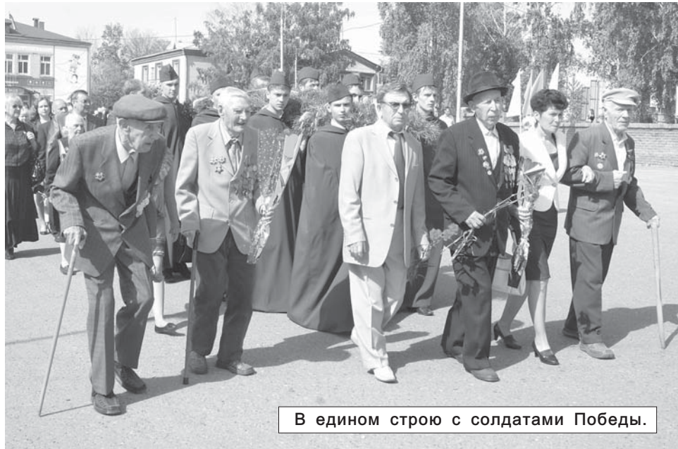
В едином строю с солдатами Победы.

4-5 мая на центральном стадионе "Труд" г. Ульяновска сборная команда ДЮСШ района участвовала в первенстве области среди детско-юношеских спортивных школ по легкой атлетике. В командном первенстве среди сельских спортивных школ цильнинцы одержали уверенную победу, оставив позади другие сельские спортшколы. В личном первенстве наши воспитанники выступили очень убедительно, что и обеспечило командную победу.