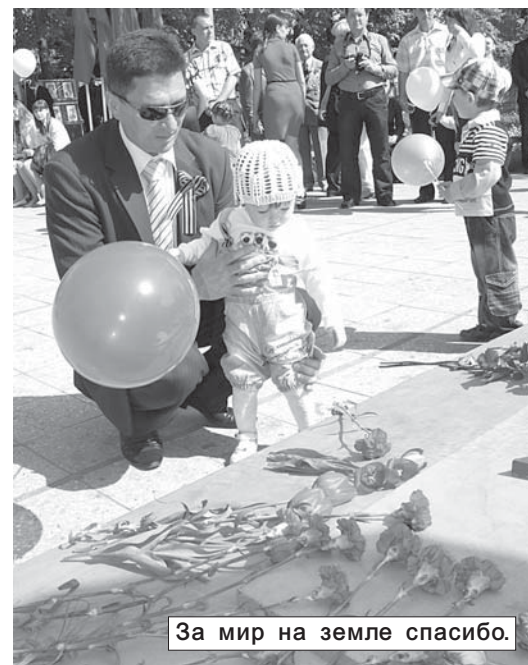
За мир на земле спасибо.

67-ю годовщину Победы отметили во всех поселениях.