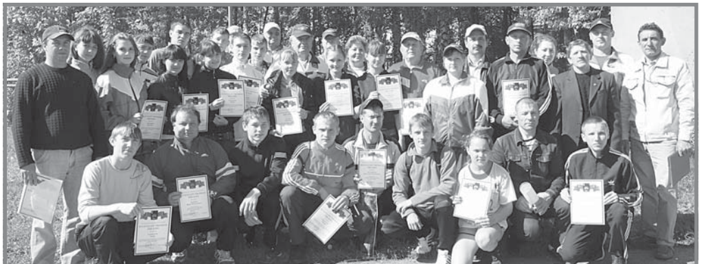
11 мая на стадионе в р.п. Цильна до начала соревнований по легкой атлетике (об этом подробнее в следующем номере) состоялось награждение участников эстафеты на призы газеты "Ульяновская правда".

чение, не увлечение только ради победы, славы. Спорт для нас - это образ жизни, это здоровье, это воспитание духа, смелости, ловкости. Все это ведет к победе на престижных соревнованиях региона, Приволжского федерального округа и всей России. И участие в таких турнирах, соревнованиях дает настрой на будущие старты, а многие из них становятся победными. Так, несколько лет подряд наши спортсмены становятся лучшими в областной эстафете на призы газеты "Ульяновская правда".