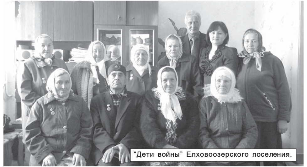
"Дети войны" Елховоозерского поселения.