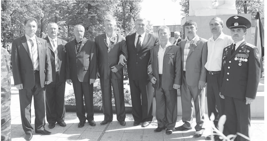
Фото на память войнов-интернационалистов с Главой района.

Праздник продолжился на площади Революции, который объединил людей