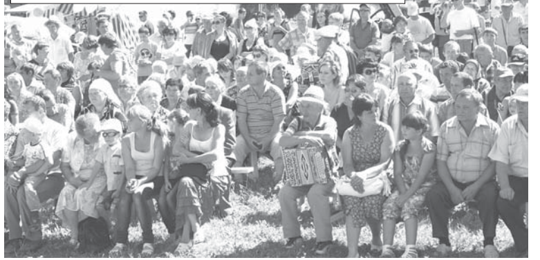
С каждым годом гостей праздника становится все больше.

никого не оставили безучастным к происходящему. Вбить гвозди кулаком, свернуть сковороду "в трубочку", согнуть арматуру, прокатить на своих плечах двух девушек, порвать на мелкие кусочки толстые карандаши и справочники, полезать на осколках стекла - и все без видимых усилий! Это было настоящее шоу.