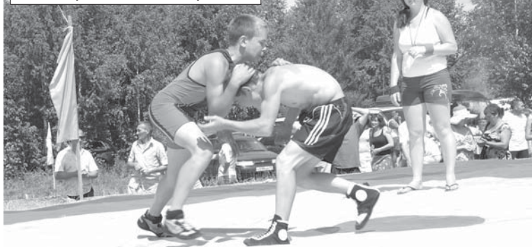
На ковре "кипели страсти".

имя созидательного труда во благо района.