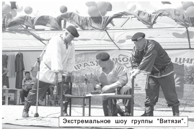
Экстремальное шоу группы "Витязи".

Особое внимание зрителей привлекло экстремальное выступление силового шоу "Витязи" (г. Тольятти). Эти три современных богатыря своими трюками