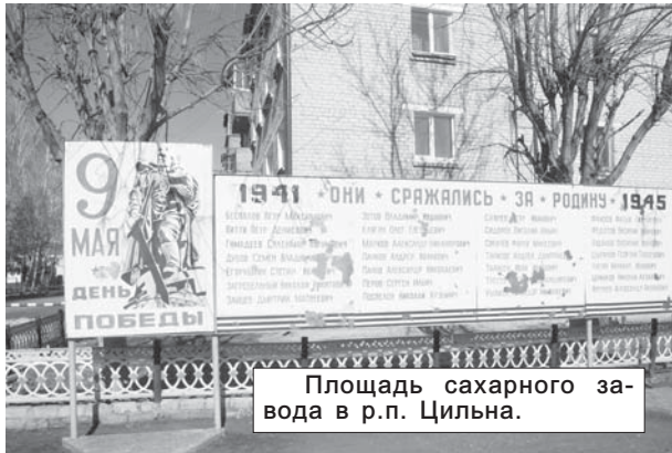
Площадь сахарного завода в р.п. Цильна.

поселка так и не вышли. В этом мы смогли убедиться сами. На площади около здания администрации завода грязно. В самом центре площади – почерневшая ледяная глыба. Пятна ржавчины уже «доедают» памятную доску, на которой были написаны имена участников Великой Отечественной войны. Именно «были»... Потому что еще немного и от этих имен ничего не останется. Но дела до этого, вероятно, никому из заводчан нет. Еще один проблемный участок в рабочем поселке – овраг в районе бывшей нефтебазы. Чего здесь только нет! И старые пластиковые бутылки в несчетном количестве, и кучи навоза, и бытовой, и строительный мусор... Виноваты в этом сами жители близлежащих домов. Нет у нас пока чувства ответственности за то место, где мы живем. И жителям, и руководителям, и участковым уполномоченным милиции нужно сделать для себя определенные выводы и сообща бороться с этим злом – захлываемыми территориями и несанкционированными свалками.