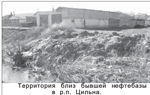
Территория близ бывшей нефтебазы в р.п. Цильна.

За прошедший период основная работа проводилась по санитарной очистке территорий. Население активно включилось в работу. Убраны скверы, террито-