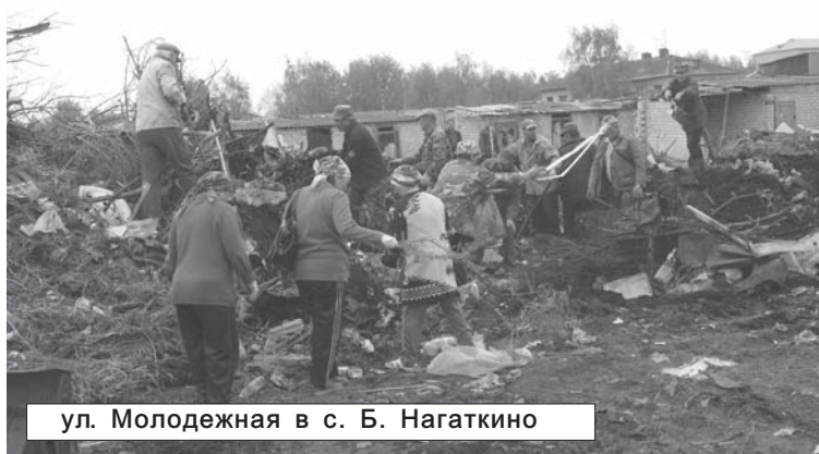
ул. Молодёжная в с. Б. Нагаткино

Примером подобного безразличия к состоянию родного посёлка в Большом Нагаткине может служить огромная свалка на улице Молодёжная. Скрытая от глаз со всех сторон сараями и гаражами, она просуществовала здесь несколько лет. Буквально в 100 метрах от зловонной кучи находятся две детские площадки. В