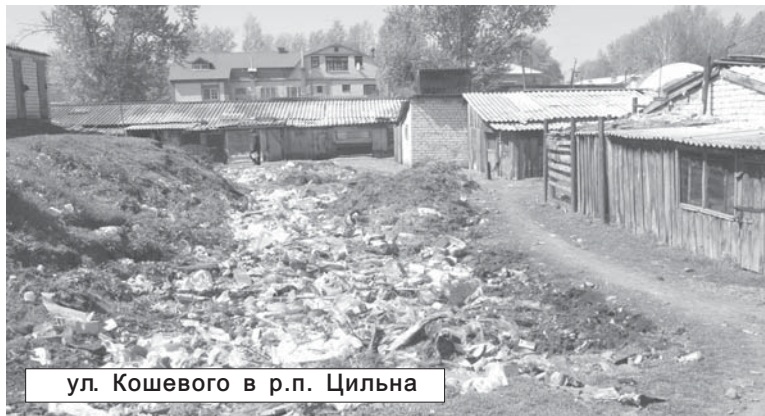
ул. Кошевого в р.п. Цильна

Более сотни цильнинцев еженедельно выходят на санитарную уборку территорий. Активное участие в благоустройстве принимают коллективы организаций района, как Управление Пенсионного фонда, газовой службы, финансового управления администрации района, Министерства социального развития Ульяновской области по Цильнинскому району. Сотрудники этих учреждений регулярно наводят порядок не только на территории административных зданий, но и на закрепленной за ними территории.