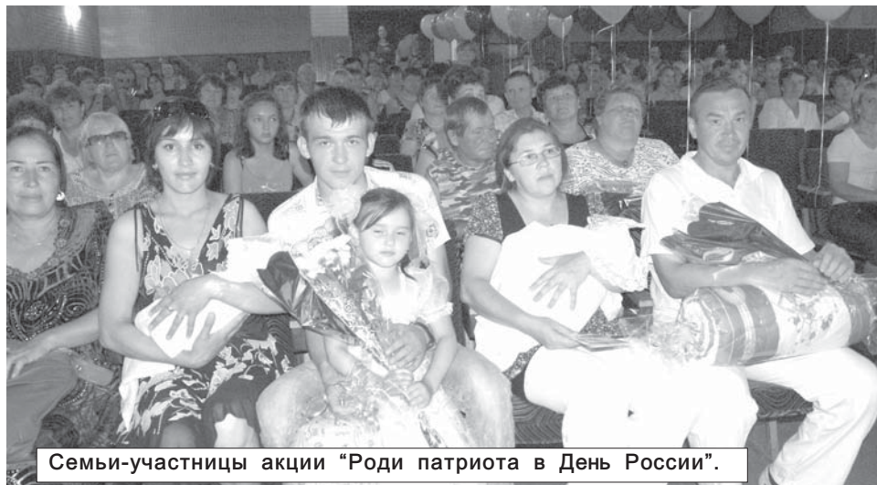
Семьи-участницы акции "Роди патриота в День России".