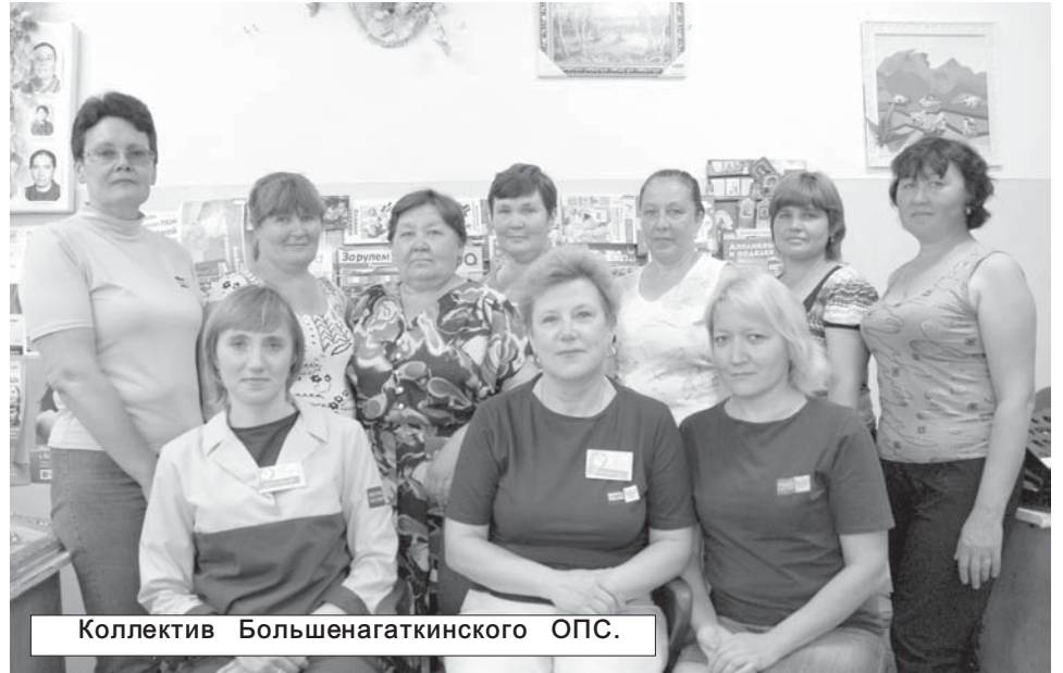
Коллектив Большенагаткинского ОПС.