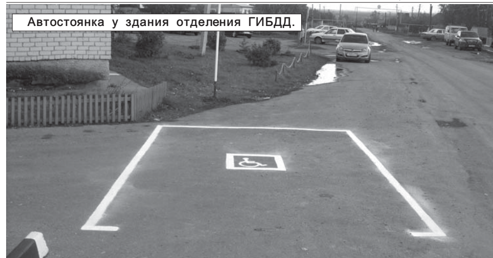
Автостоянка у здания отделения ГИБДД.

Уже в понедельник вода стала чистой. Как заверили нас в ООО "Тепловод" - все проблемы устранены. На месте происше-