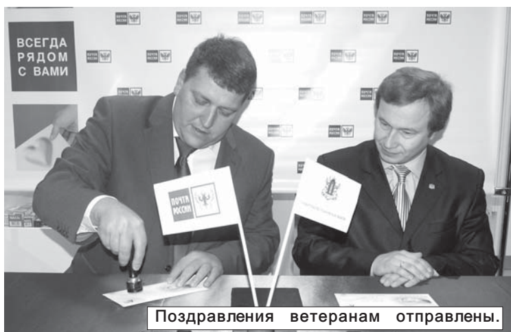
Поздравления ветеранам отправлены.

Работники культуры района подготовили для почтовиков хорошую концертную программу. Было в ней все - и песни в исполнении групп и солистов районного Дома культуры и Цильнинского центра культуры и спорта, были и танцы в исполнении воспитанников детского сада "Сказка" и Анны Мыниной.