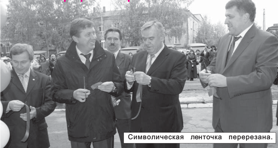
Символическая ленточка перерезана.

В этот день много говорили о будущем, о развитии, о том, что "Почта России", а вместе с ней и весь Цильнинский район, идут рука об руку только вперед. И повод для этого был весомый - 5 октября после масштабной реконструкции открылось Большенагаткинское отделение почтовой связи. Ремонт завершился накануне празднования Всемирного дня почты (9 октября). На открытие отделения и на празднование профессионального праздника в районном центре собрались многочисленные гости - сотрудники Управления Федеральной почтовой связи из всех районов области.