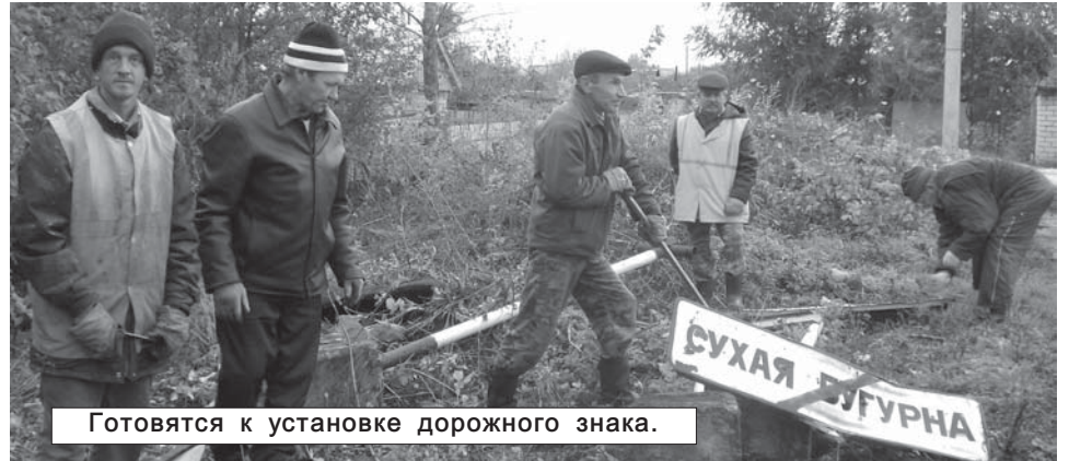
Готовятся к установке дорожного знака.