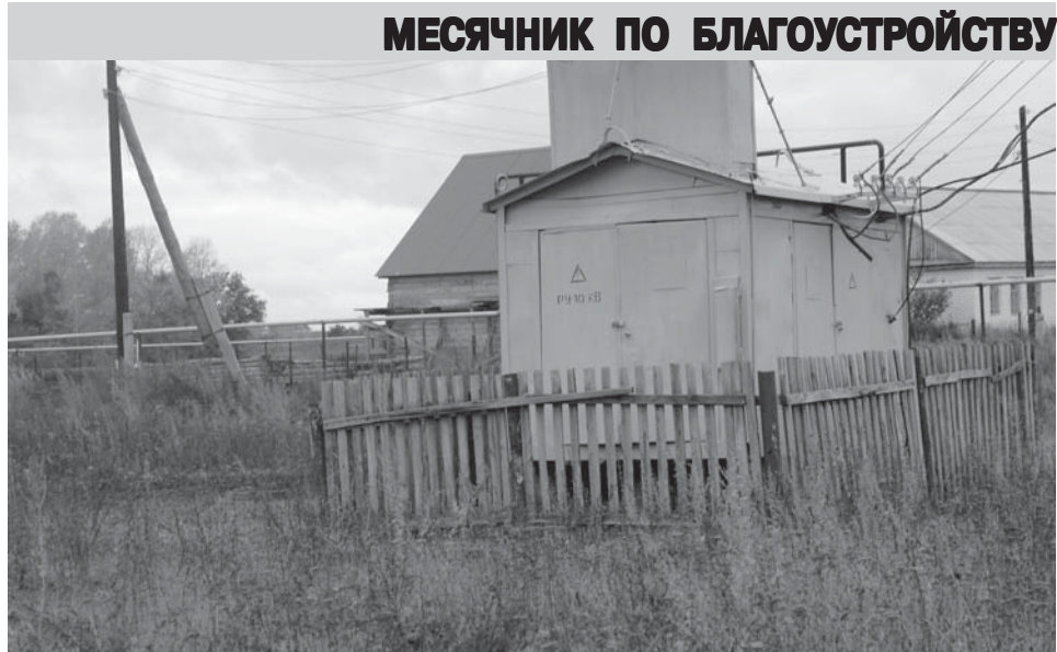
МЕСЯЧНИК ПО БЛАГОУСТРОЙСТВУ