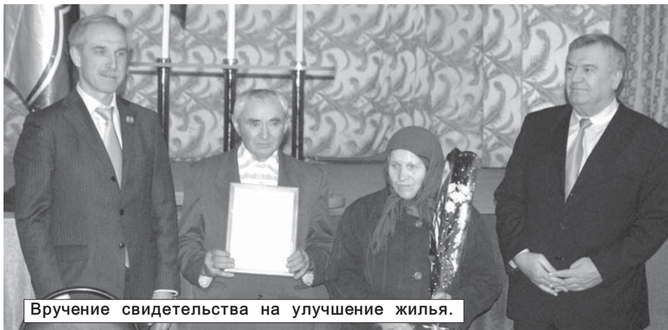
Вручение свидетельства на улучшение жилья.

Как сообщает пресс-служба Правительства области, в регионе с 14 по 20 октября из оборота изъято более 1700 литров фальсификата и около 500 литров спиртосодержащей продукции. За указанный период составлено более 70 протоколов, связанных с незаконным оборотом алкоголя. Больше количество административных штрафов составлено за нарушения правил продажи этилового спирта и незаконную реализацию. Пресечено более 50 фактов реализации алкоголя несовершеннолетним.