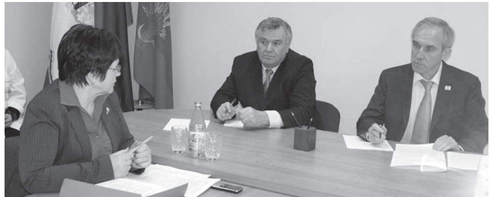
Руководство области и района обсудили вопросы здравоохранения.