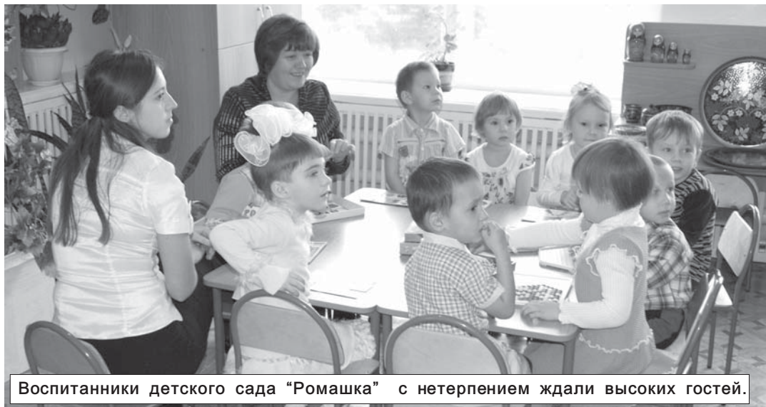
Воспитанники детского сада "Ромашка" с нетерпением ждали высоких гостей.