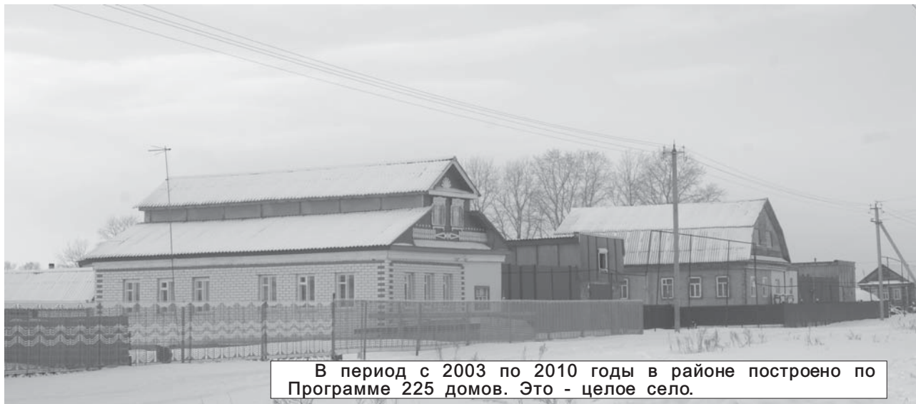
В период с 2003 по 2010 годы в районе построено по Программе 225 домов. Это - целое село.

Из районного бюджета на эти цели мы оказывали помощь еще 285 цильнинцам. Вряд ли кто из других районов области может привести такие примеры.