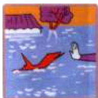
ОТТАЛКИВАЙТЕ ОПАСНЫЕ ПРЕДМЕТЫ С ОСТРЫМИ КРАЯМИ