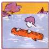
ДЕРЖИТЕСЬ ЗА ПЛАВАЮЩИЕ ПРЕДМЕТЫ