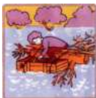
ПОПЫТАЙТЕСЬ СВЯЗАТЬ ИЗ ПЛАВАЮЩИХ ПРЕДМЕТОВ ПЛОТ И ЗАБРАТЬСЯ НА НЕГО